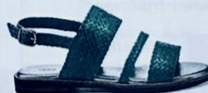
Sandali in pelle intrecciata, Frau (105 euro).