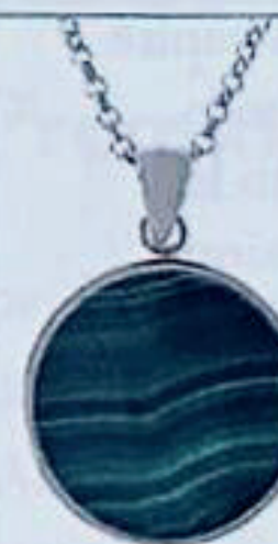
Collana lunga in Golden Rosé e malachite, Bronzallure (159 euro).