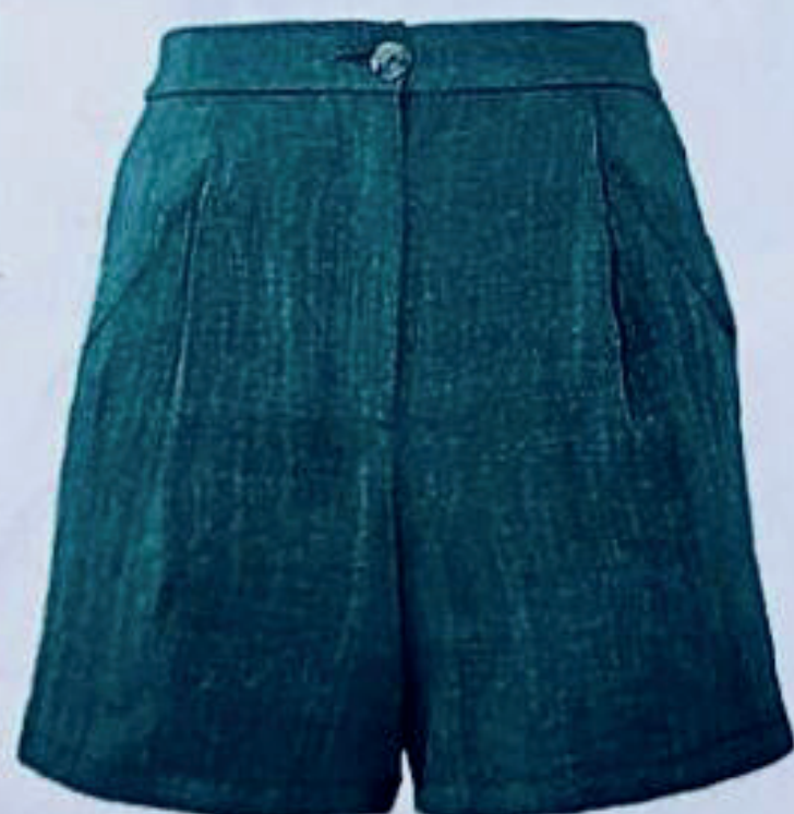
Shorts in lino, Monki (30 euro).

Influenze tribali, stampe orientali, ricami marocchini: interpreta con personalità e stile il trend etnico, mixando con originalità stampe e colori. Crea un look da spiaggia facile e pratico, ma con dettagli speciali, proprio come quello di Beyoncé: kaftano, shorts, una borsa artigianale e sandali rasoterra. Perfetto per andare in spiaggia ma anche per un aperitivo al tramonto.