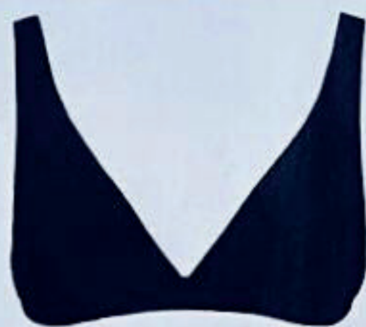
Bikini in microfibra, Essential di Yamamay (44,90 euro).