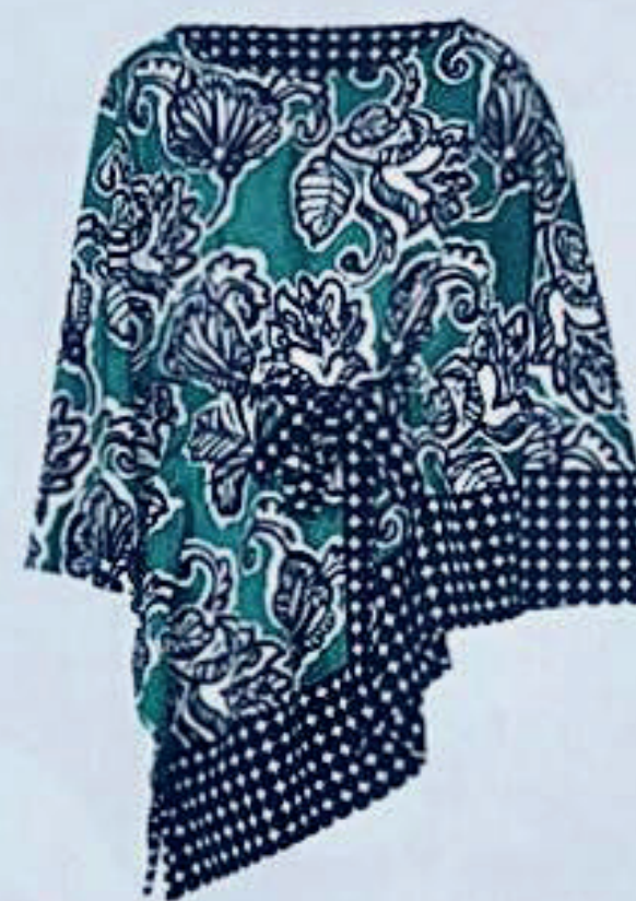
Tunica in satin, Carla Ferroni (70 euro).

La cantante Beyoncé Knowles, 38 anni, e la sorella Solange, 33, da sempre impegnate in favore dei diritti delle minoranze, sono in prima linea nella campagna Black Lives Matter.